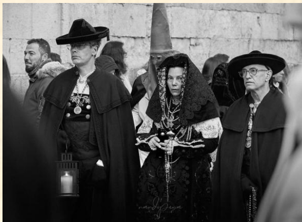
Hermandad Dominicana vistiendo el traje charro de luto. © Fernando Pena.

Fundada en 1506, la hermandad más antigua es la Cofradía de la Vera Cruz, y la más joven es la Cofradía Penitencial del Rosario, creada en 2019. El carácter universitario de la ciudad queda reflejado en la Hermandad Universitaria, y el folclore charro en el traje de luto charro que visten la sección de cofrades que precede a Nuestra Señora de la Esperanza de la Hermandad Dominicana y el traje de luto charro de ventioseno en la Sección de la Liberación de la Hermandad del Cristo del Amor y de la Paz.