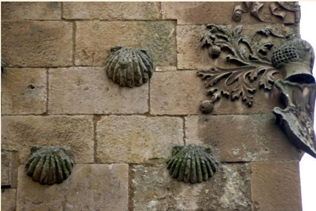
Detalle de la fachada.

Al igual que otros monumentos de la ciudad, la Casa de las Conchas también cuenta con varias leyendas. Una de ellas afirma que bajo una de las conchas de la fachada se encuentra escondida una onza de oro. También se dice que los Jesuitas quisieron demoler el edificio para que se viera mejor la Clerecía (edificio situado enfrente), y que ofrecían una onza de oro por cada concha que fuese arrancada.