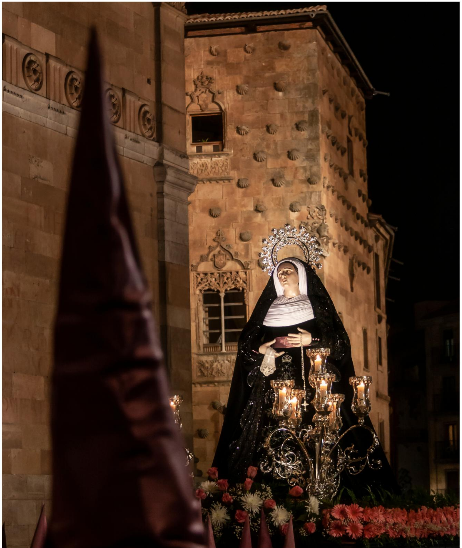
IMAGEN DE CANDELERO

Tallas que tienen trabajadas sólo las partes visibles, como cabeza y manos, y que pueden ser móviles para adaptarse a la representación de momentos evangélicos.