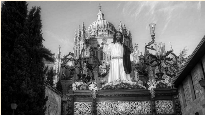
Nuestro Padre Jesús de la Redención en la Institución de la Sagrada Eucaristía.

En la fotografía, la Cofradía Penitencial del Rosario en su desfile del Sábado de Pasión. Destaca por tener uno de los pocos pasos cargados a costal de Salamanca; 90 costaleros en dos turnos de carga llevan a Nuestro Padre Jesús de la Redención en la Institución de la Sagrada Eucaristía por las calles de Salamanca.