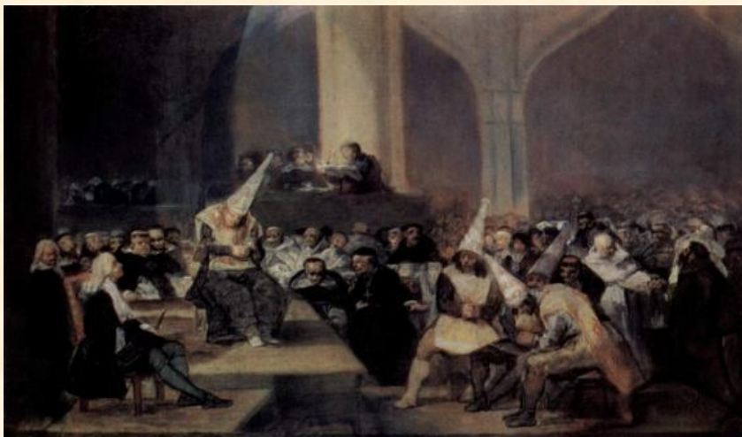
Auto de fe de la Inquisición de Francisco de Goya.

En contra de lo que se podría pensar, el origen del capirote no guarda relación directa con la Semana Santa, sino con la Santa Inquisición.