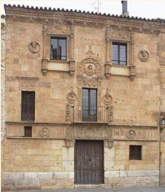
Fachada de la Casa de las Muertes.

La fachada, esculpida en piedra de Villamayor y declarada Bien de Interés Cultural en 1938, está considerada una de las mejores expresiones del plateresco de la ciudad. En el medallón central se encuentra el busto de Alfonso de Fonseca y el escudo de armas de la familia Anuntzibai. Los elementos más populares de la fachada son las cuatro calaveras que sobresalen de la misma y que parecen colgar de las jambas de las ventanas superiores. Calaveras que tienen mucho que ver con el nombre con el que se conoce a este edificio, aunque no son el único motivo.