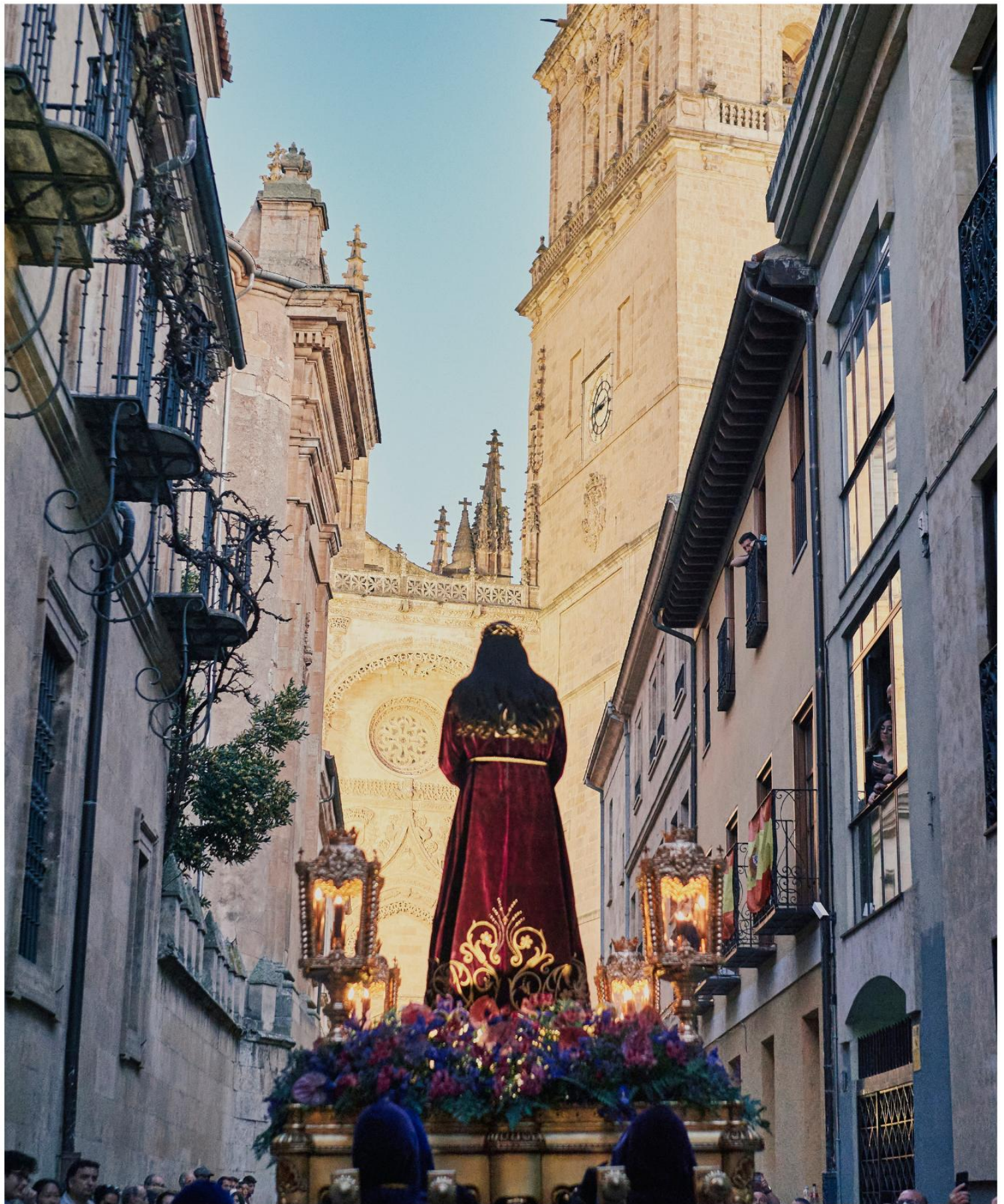
IMAGEN DE VESTIR

Tallas que son diseñadas para ser vestidas.