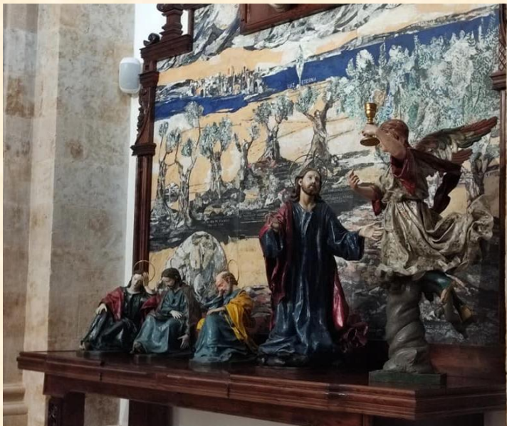
El paso en la Iglesia del Carmen de Abajo.

El estandarte es uno de los elementos distintivos de las cofradías.