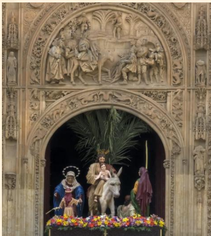
“La Borriquilla” saliendo por la Puerta de Ramos de la Catedral Nueva.

Los hermanos y hermanas de carga de la «Borriquilla», como se conoce popularmente al paso «Entrada triunfal de Jesús en Jerusalén», hacen un pasillo de honor, a modo de homenaje y reconocimiento, a la salida del paso cargado por los más jóvenes.