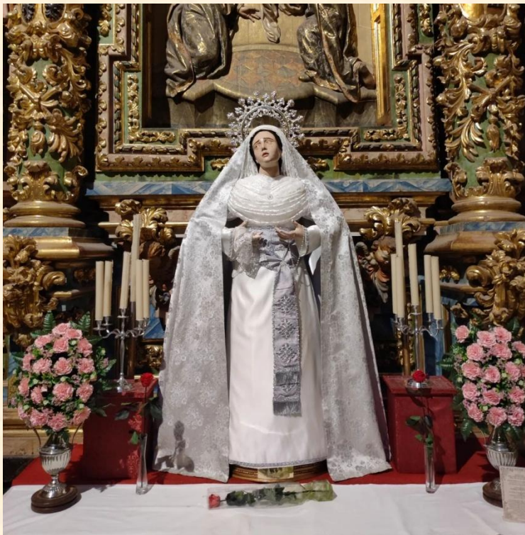
Nuestra Señora de las Lágrimas.

La imagen, de caracteres andaluces, recuerda en su mirada dirigida hacia arriba y en su expresión a los cánones castellanos. La corona que porta en la actualidad la estrena en 2019 y es una donación del escultor. Fue restaurada en 2012, año en el que se sustituyen las lágrimas por unas de cristal.