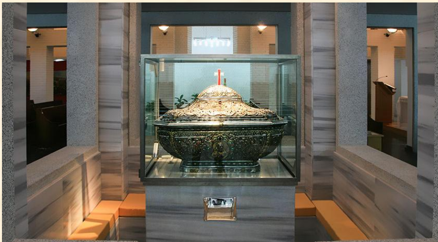
Urna en la que se custodian las reliquias de San Juan de Mata.

Representa a Cristo condenado a muerte en una iconografía propia del Ecce Homo ; Jesús tras la flagelación y coronado de espinas. Esta imagen tiene su sede canónica en la Iglesia San Juan de Mata.