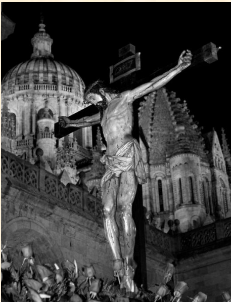
Cristo del Amor y de la Paz. © Vicente Cid.

La palabra en español paso procede del latín passus , que significa sufrimiento. Si nos acercamos a la Real Academia Española, la define como «cada uno de los sucesos más notables de la pasión de Jesucristo» y como «efigie o grupo que representa un suceso de la pasión de Cristo, y se saca en procesión por la Semana Santa». Siendo esta última la que se ha recogido para la exposición.