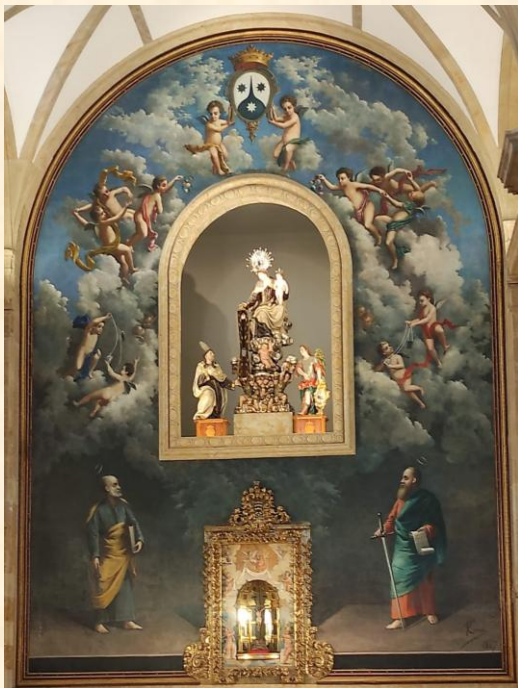
Altar Mayor del Carmen de Abajo.

La Iglesia de la Venerable Orden Tercera del Carmen, conocida popularmente como la iglesia del Carmen de Abajo, es una de las 3 edificaciones que quedan del Convento de San Andrés, el que fuera considerado el Escorial salamantino.