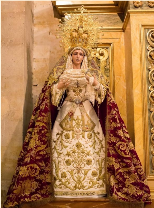
María Santísima de la Caridad y del Consuelo.

María Santísima de la Caridad y del Consuelo es una dolorosa obra de Francisco Romero Zafra. Sus rasgos suaves y su mirada al frente, acompañada por seis lágrimas de cristal, dotan al rostro de una expresividad contenida que transmite dulzura y un dolor comedido.