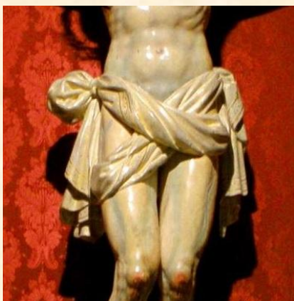
Detalle del paño de pureza.

El Santísimo Cristo de los Doctrinos es una talla barroca anónima de finales del s. XVII que representa a Cristo muerto con la cabeza ladeada a la derecha. A los pies de la cruz se encuentra la calavera de Adán. Uno de sus rasgos distintivos es el paño de pureza enrollado por delante y en forma de aspa que deja al descubierto las caderas.