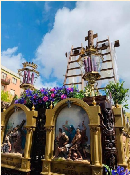
Andas del paso Camino del Calvario de la Hermandad del Perdón.

Las 14 estaciones son «paradas» en las que se meditan los distintos pasajes del santo Vía Crucis.