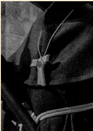
Detalle de la cruz de tau que portan los miembros de la Hermandad Franciscana.