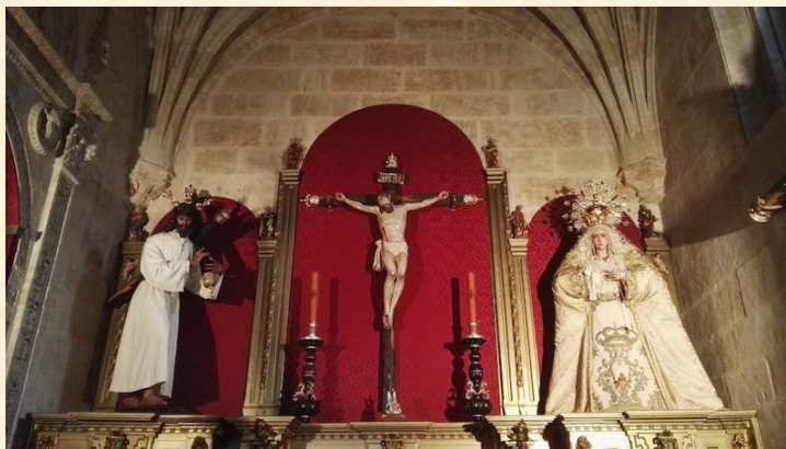
Nuestra Señora de la Esperanza en la Capilla de la Hermandad Dominicana en el Convento de San Esteban.

La imagen tiene su sede canónica en la capilla que la hermandad tiene en el Convento de San Esteban, lugar desde el que hace su salida la madrugada del Viernes Santo, con las luces de la Plaza del Concilio de Trento apagadas.