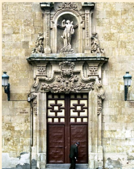
Portada principal de la Iglesia de San Sebastián.

En 1755, como consecuencia del terremoto de Lisboa, sufrió importantes daños. Fue restaurada en el año 2008 y se recuperó la puerta lateral que había estado tapiada desde finales del siglo XIX. Actualmente es la parroquia de la Catedral.