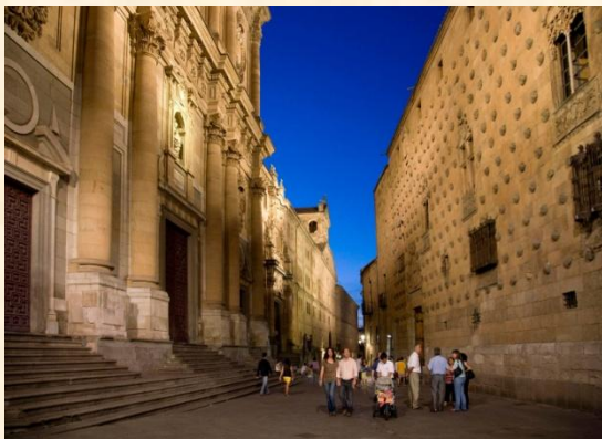
Calle de la Compañía.

Le debe su nombre a la Compañía de Jesús que en el s. XVII se asentó en esta calle, más concretamente en el Colegio del Espíritu Santo que desde 1940 alberga la Universidad Pontificia.