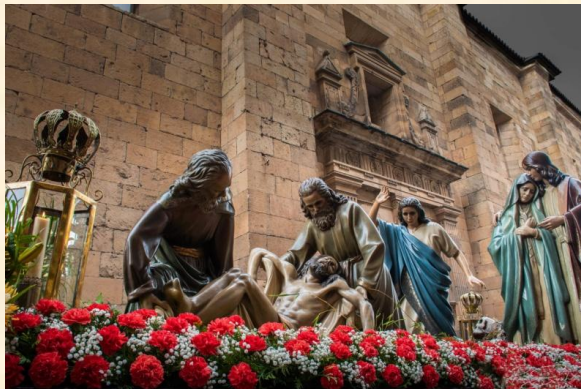
“Santo Entierro” de Francisco González Macías.

Tras la Guerra Civil, tiene lugar en el país un proceso de restitución de las tallas destruidas durante la contienda. Fruto de ese resurgir de la actividad escultórica de carácter religioso es la Escuela de Imaginería de Salamanca que, a pesar de su fugaz existencia, realizó una gran aportación a la imaginería del siglo XX. De esta escuela surgieron numerosos pasos para la Semana Santa salmantina y de otros lugares de España.