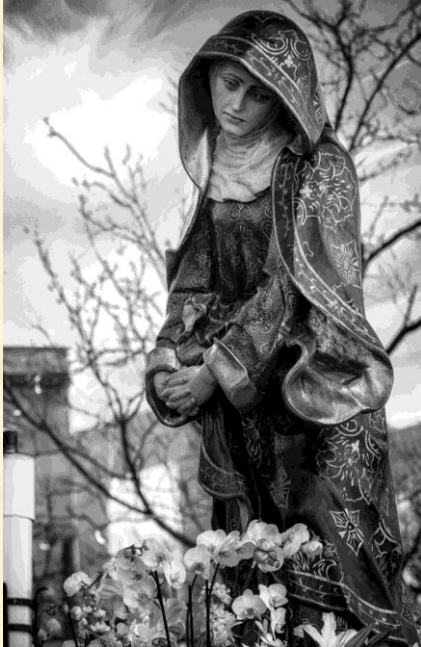
Nuestra Señora del Silencio.

Nuestra Señora del Silencio es una dolorosa tallada en 1990 por Enrique Orejudo. Desfila el Sábado Santo con la Hermandad del Silencio sobre andas de carga interior y portada por turno de carga mixta.