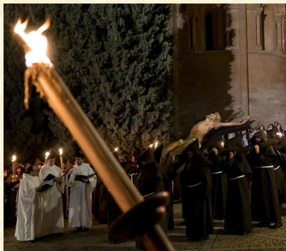
Oración en el Patio Chico.

A las diez de la noche, coincidiendo con la salida de la marcha penitencial del Santísimo Cristo de la Humildad , todos los conventos de clausura franciscanos de Salamanca, y de otros lugares de España y del mundo, se unen a la hermandad en una oración que les arropará durante la procesión. En Salamanca se unen también los conventos de todas las órdenes religiosas de la provincia.